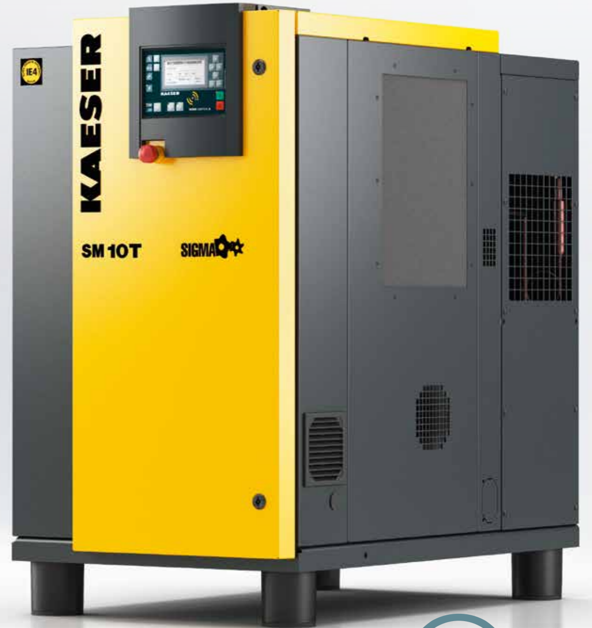
Imagen: SM 10 T

Todos los servicios de mantenimiento pueden llevarse a cabo por un solo lado. Para ello, el panel izquierdo del gabinete es desmontable, y desde allí es sencillo acceder a todos los puntos de mantenimiento.