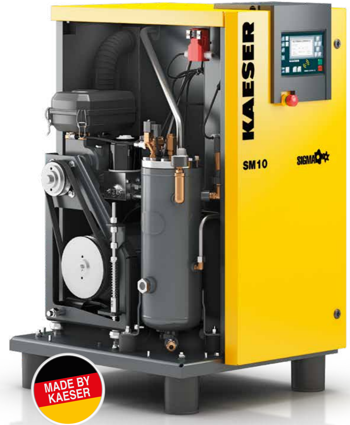
Imagen: SM 10

Hasta 96 % aprovechable en forma de calor