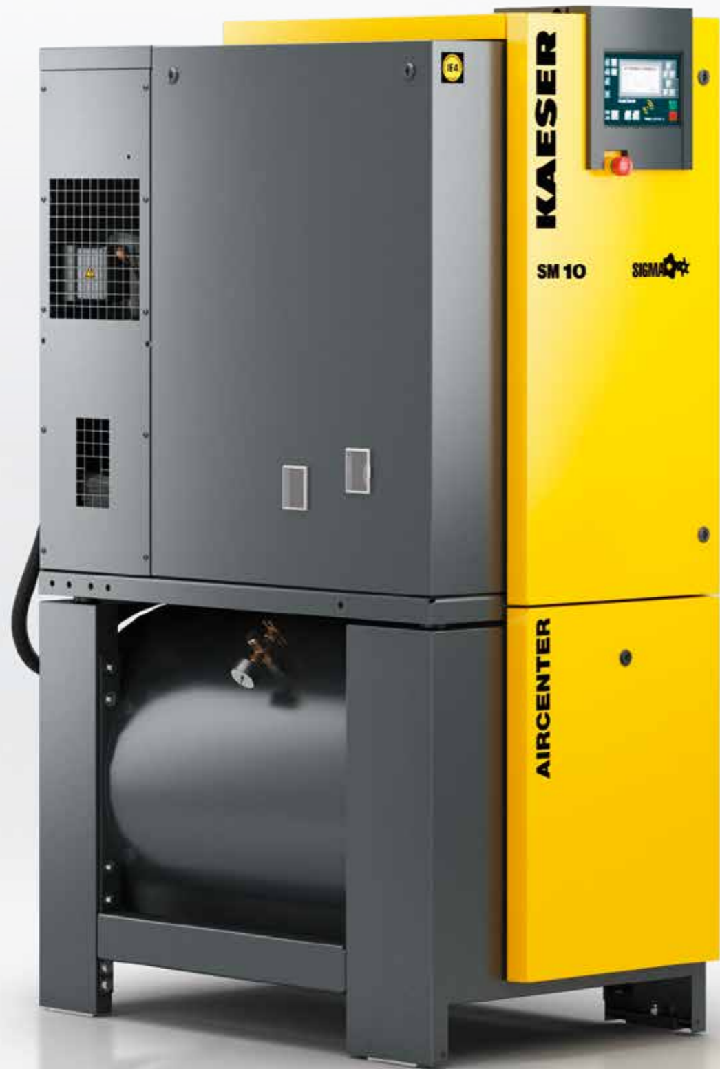
Imagen: AIRCENTER SM 10